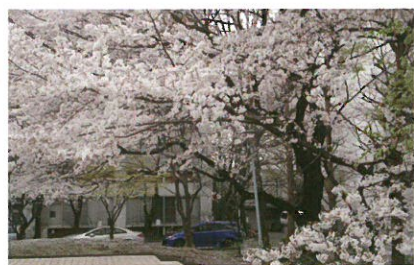
◀自然豊かなキャンパス内は四季の散歩コース