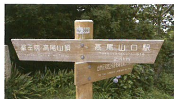
▲▶ 特急で新宿まで15分! 高尾山まで約30分