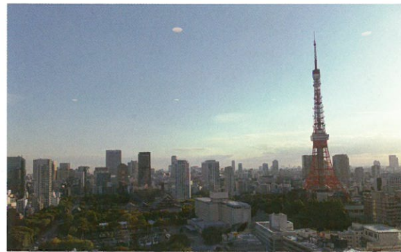
◀東京タワーまで 歩いて15分