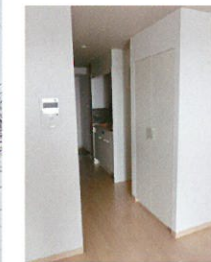
◀バストイレ別 宅配ボックス付