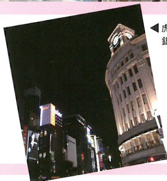
◀虎ノ門ヒルズ 銀座も近いです