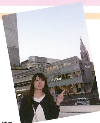
◀寮は2つあります (徒歩5分と15分)